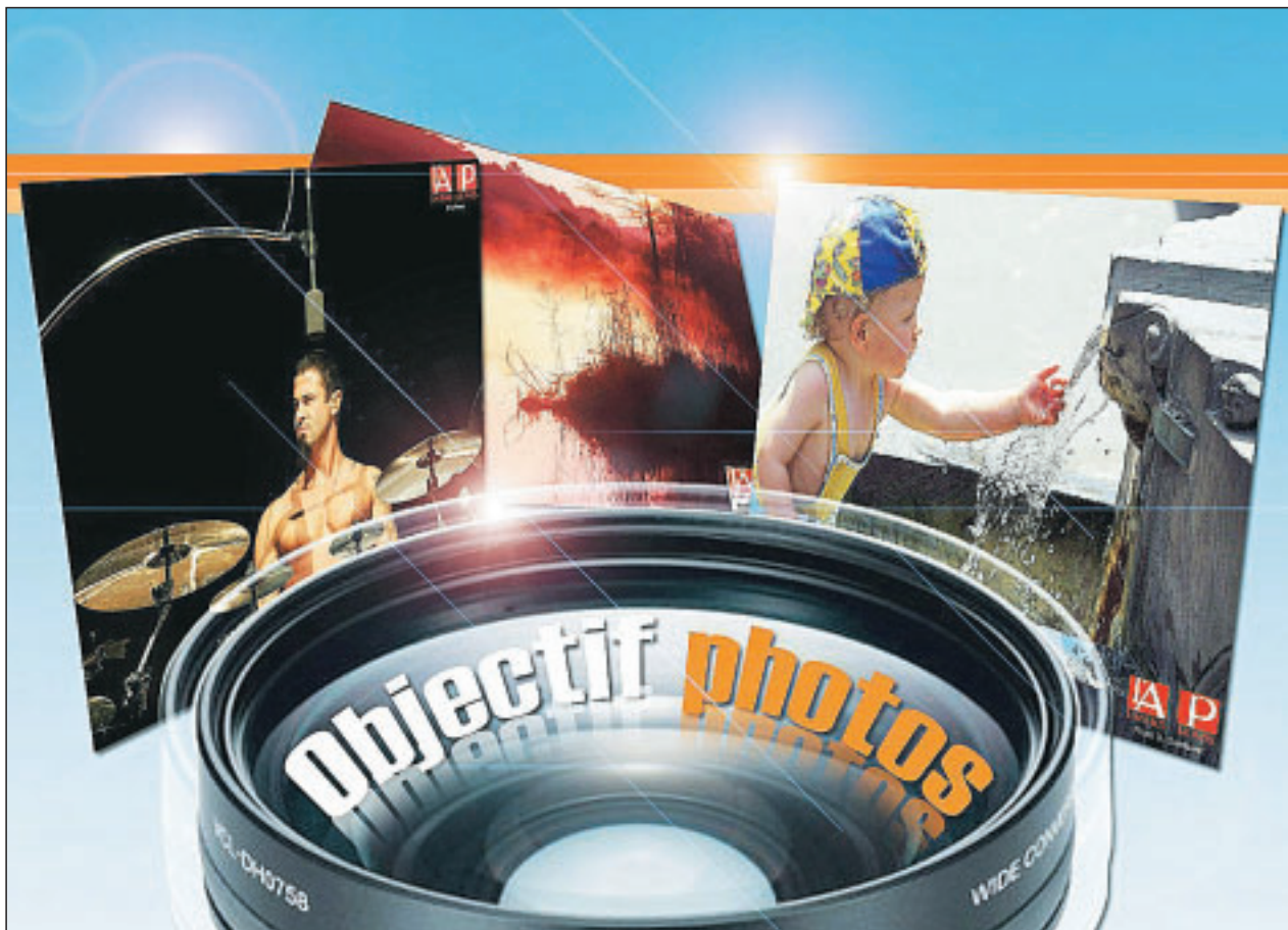
ILLUSTRATION STÉPHANE PIERREZ

Après le lancement du blog, nous vous proposons un nouveau service pour montrer vos photos et découvrir les nôtres. Ça s'appelle Objectif photos.