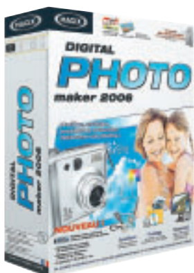
Photo Maker 2006 propose un détecteur d'images similaires.

« Digital Photo Maker 2006 ». Éditeur Magix. Pour PC. 39,99 €.